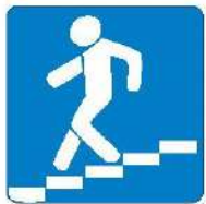
Знак 6.6. Подземный пешеходный переход

Самые безопасные переходы — подземный и надземный. Они обозначаются вот такими знаками.