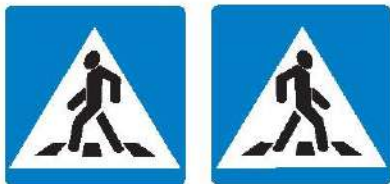
Знаки 5.19.1 и 5.19.2 Пешеходный переход

Если нет подземного или надземного пешеходного перехода, можно перейти по наземному пешеходному переходу